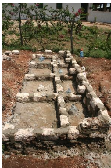
Het gaat vooruit!

Tijdens een meeting met het oudercomité werd me gevraagd hoe ik het probleem van het loon van de leerkrachten kon oplossen. Ik heb hun eerlijk geantwoord dat ik daarvoor geen oplossing had, omdat Rainbow4kids zich al geëngageerd had om het lunchprogramma (6000 euro/jaar) op zich te nemen. Ik vertelde hen dat ik dit engagement wou kunnen verder zetten in de toekomst. Maar een vast loon uitbetalen aan de leerkrachten, daarvoor kan Rainbow4kids niet bijspringen.