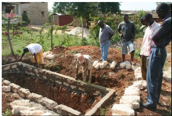
Aan het berekenen hoeveel toiletten we kunnen maken.

Ondertussen zijn ze wel al begonnen met het verder afwerken van de toiletten (dankzij extra sponsoring).