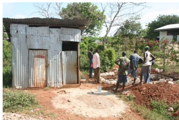
Dit "grijze" gebouwtje bevat de huidige toiletten.