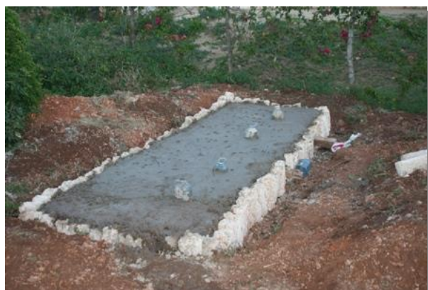
Het gieten van de grondplaat.