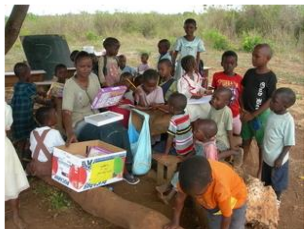
Aanbieden van nieuwe telpuzzels

Tijdens mijn verblijf heb ik eerst de ingezamelde kledij, die met de container zijn meegekomen, in de drie scholen uitgedeeld. Ik heb 400 kinderen kunnen blij maken met één kledingstuk: een broek, t-shirt, rok of hemd. De dankbaarheid zag je op hun gezichtjes. Enkele kinderen vroegen me in het swahili ☺ of ze dit echt mochten meenemen naar huis.